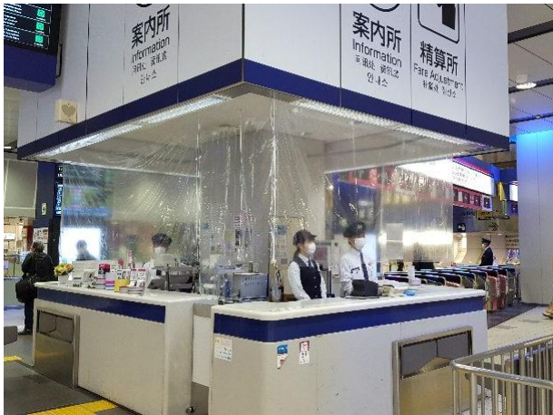
ビニールカーテンの設置（駅窓口）