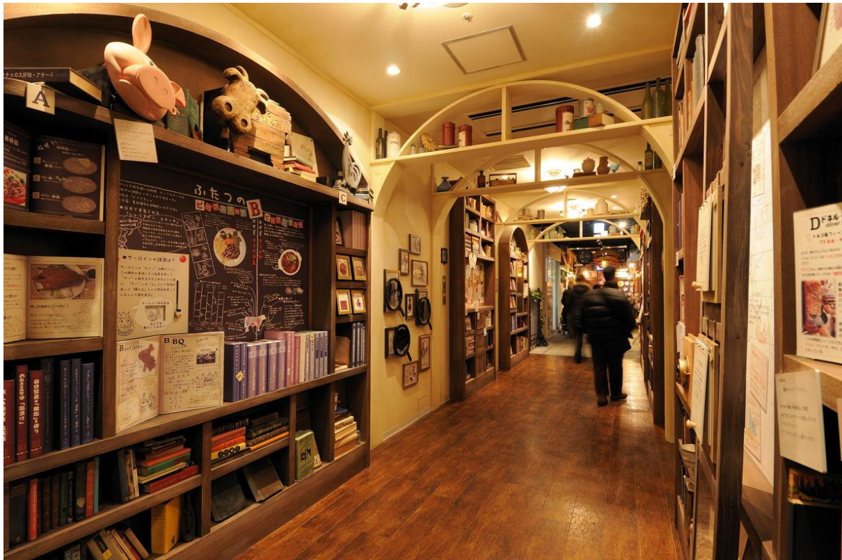
《東京ミートレア お肉のミュージアム》