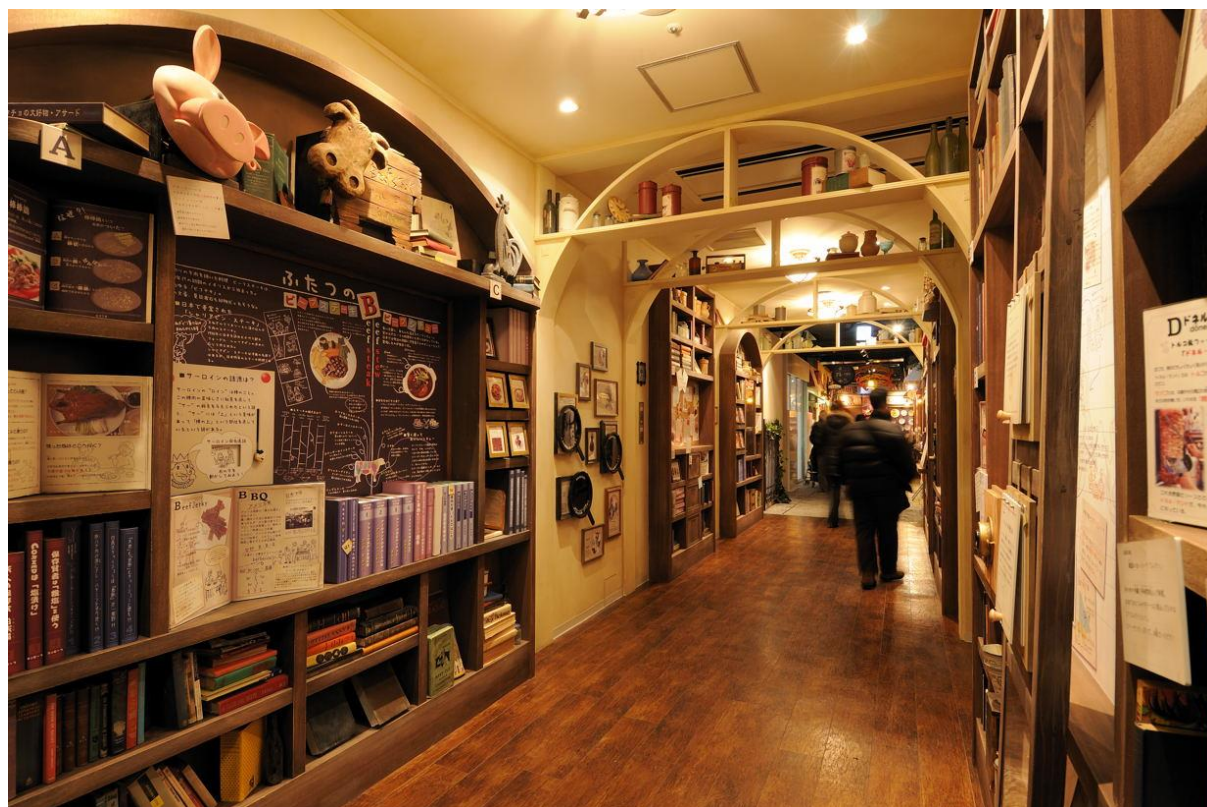
《東京ミートレア お肉のミュージアム》