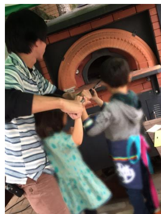
《石窯ピザイメージ》

お問い合わせ先：TEL. 050-5835-0493 (10:00～18:00)