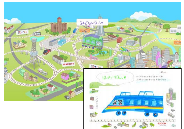
《紙トレインを描こう!》 (㊤モニター ㊦専用紙)