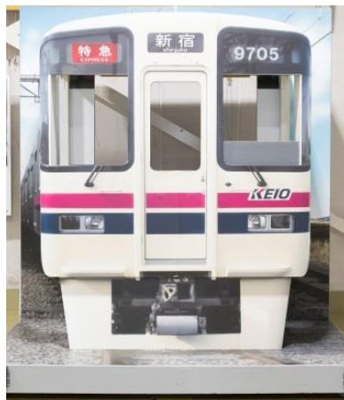
《京王電鉄展示コーナー》 (写真撮影ブース)