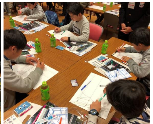
≪前回の「鉄道ダイヤ作成体験教室」の様子≫