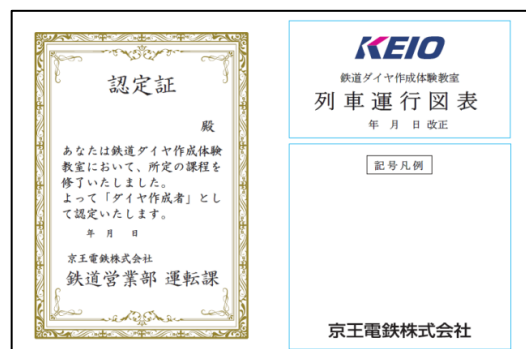
《オリジナル認定証の記念品》