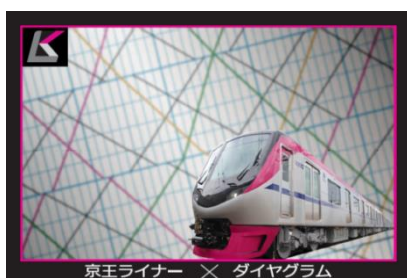
《オリジナルトレーディングカード》

※ご応募いただいたお客さまの個人情報、本イベントに関する事務および、今後のイベントに関するお知らせ以外の目的で使用することはございません。