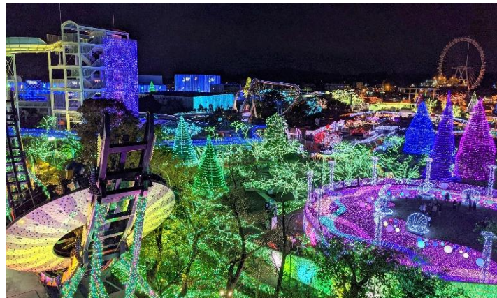
《「ジュエルミネーション」（昨年の様子）》