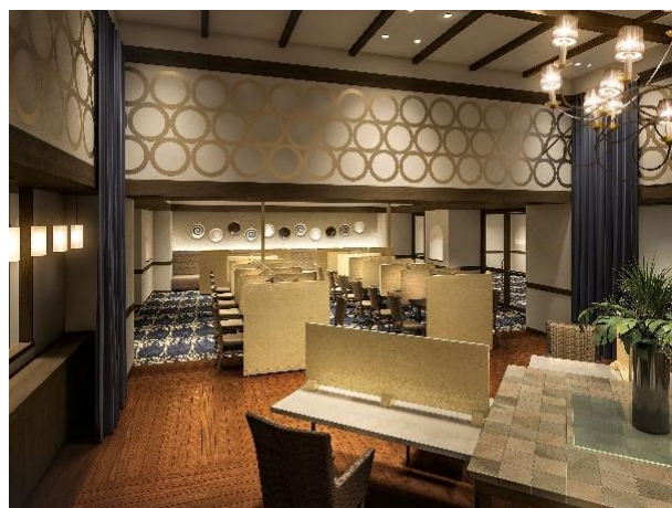
[KEIO BIZ PLAZA 新宿・都庁前 執務エリアイメージ]