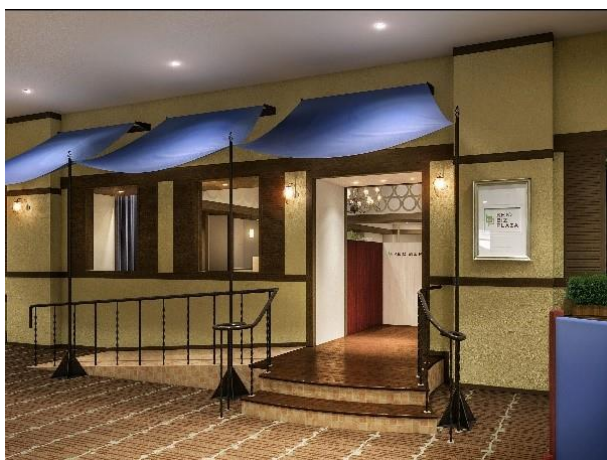
[KEIO BIZ PLAZA 新宿・都庁前 エントランスイメージ]

なお「KEIO BIZ PLAZA 新宿・都庁前」では入退会、施設予約等手続きのオンラインシステムが導入されており、店舗への入退室はお客様自身のスマートフォン等に発券されるQRコードを用いて管理します。これにより非接触・非対面でいつでも手続きが可能になっています。また全店利用プランも用意し、登録店舗以外でも各店舗の相互利用が可能となります。この取り組みにより、今まで以上にワークライフバランスの実現等、柔軟な働き方に貢献するとともにホテルのさらなる活性化を進めてまいります。