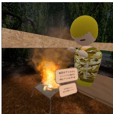
《キャンプ体験のイメージ》