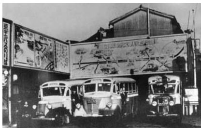
1940（昭15）年頃のバスの新宿追分折返場