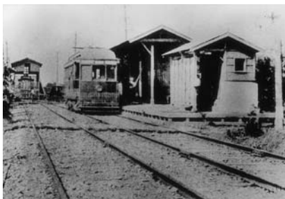
1914（大3）年頃の調布駅と電車

戦時下にあった1944（昭19）年、京王電気軌道は戦時立法により、東京急行電鉄株式会社と合併しました。その後、旧京王電気軌道は、同様に合併していた旧帝都電鉄（現 井の頭線）とともに、1948（昭23）年6月1日に東京急行電鉄から分離し、「京王帝都電鉄株式会社」として発足しました。