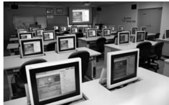
CAI（コンピューター支援教育）教室

「鉄道従事員として、自らの知識・技術の習得に努め、安全・安心・快適な鉄道であるための使命を果たせる人材を育成する」という教育方針のもと、鉄道従事員の能力・資質の向上を図るため、さまざまな教育・訓練を行っています。