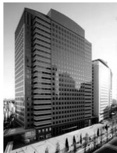
新宿文化クイントビル