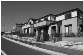
八王子みなみ野シティ