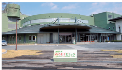
高尾の森わくわくビレッジ

本 社 〒206-8502 多摩市関戸1-9-1 代表者 代表取締役社長 高橋 昌也 資本金 50百万円 事業概要 高尾の森わくわくビレッジ整備等事業 URL www.wakuwaku-village.com/