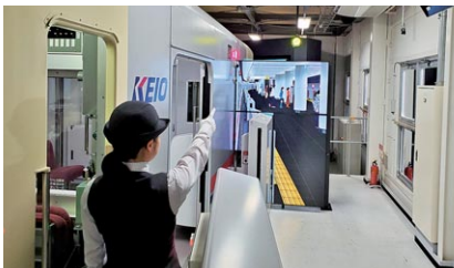
訓練の様子(上：運転士、下：車掌)