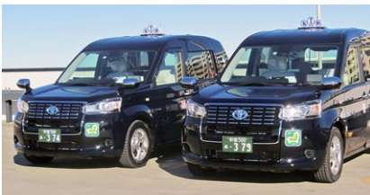
ハイブリッドタクシー

京王電鉄バスグループでは、水素と空気中の酸素で発電し走行する燃料電池バスやハイブリッドバス、ヘッドライトなどをLED化した車両を導入しています。また、西東京バスではハイブリッドバスの導入や電気バスの受託運行、京王自動車グループでは、ハイブリッドタクシーやアイドリングストップ機能付きタク