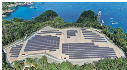
宮古市の発電設備

京王グループでは、再生可能エネルギーの活用に積極的に取り組んでいます。2015(平27)年から相模原市の社有地において、2019(令元)年から岩手県宮古市において、太陽光発電事業に取り組んでいます。