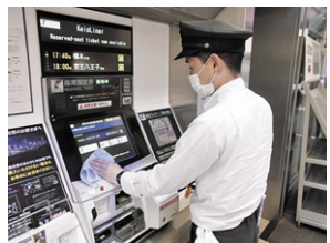
駅構内設備の消毒