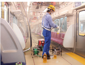
全車両に抗ウイルス・抗菌加工を実施