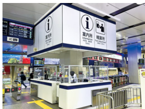
全駅の窓口に飛沫防止パネルなどを設置