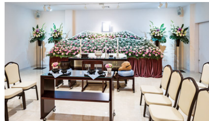
京王メモリアル多摩センター式場

京王フェアウェルサポートが運営主体となって、葬祭事業に参入し、2015年に「京王メモリアル北野」（八王子市）、2016年に「京王メモリアル調布」（調布市）、2017年に「京王メモリアル多摩センター」（多摩市）を開業しました。京王メモリアルでは、直営ホールだけでなく東京・神奈川全域の公営斎場、寺院会館、ご自宅、集会所などでも、一般葬・家族葬から直葬まで、故人様やご家族の多様化するニーズに対応した葬儀・サービスを提供します。