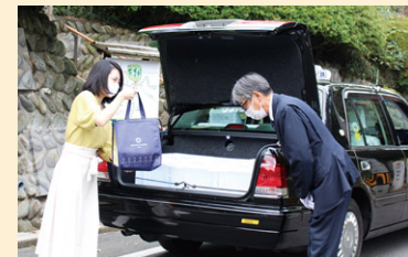
京王のグルメデリバリー