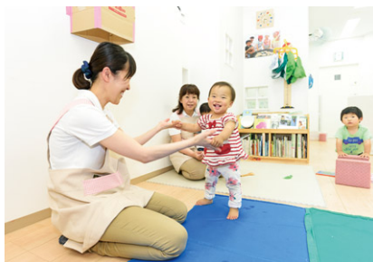
京王キッズプラッツでの保育の様子