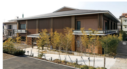
上野さくら浄苑の外観

2018年3月から、鉄道業界初となる取り組みとして、台東区にある納骨堂「上野さくら浄苑」の運営サポートサービスを開始しています。