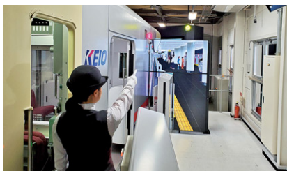
訓練の様子(上：運転士、下：車掌)