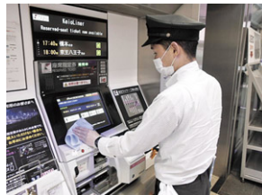
駅構内設備の消毒