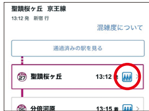
HP・京王アプリ上での混雑情報提供