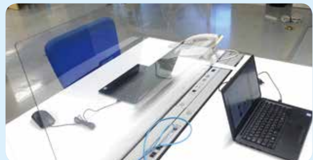
職場内に設置されたアクリル板