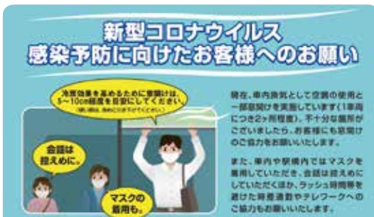
時差通勤等のご協力の呼びかけ 感染予防に向けたお客様へのお願い