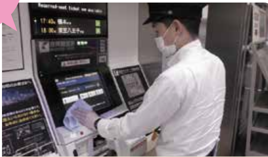
駅構内設備の消毒