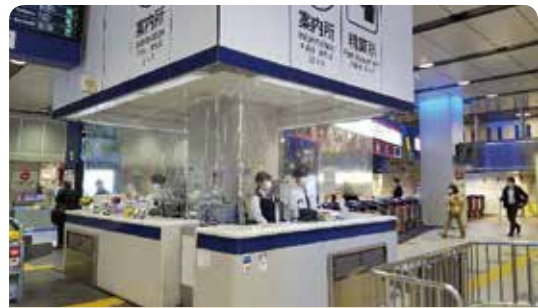
全駅の窓口 ビニールカーテンを設置