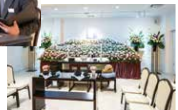
京王メモリアルの葬儀ホール