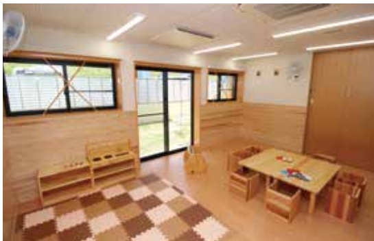
京王キッズプラッツ

認可保育所・東京都認証保育所・企業主導型保育所「京王キッズプラッツ」は、家庭的な雰囲気の中、お子様一人ひとりの発達や気持ちに寄り添い、豊かな成長をサポートします。