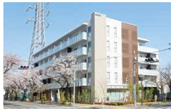
スマイラス聖蹟桜ヶ丘