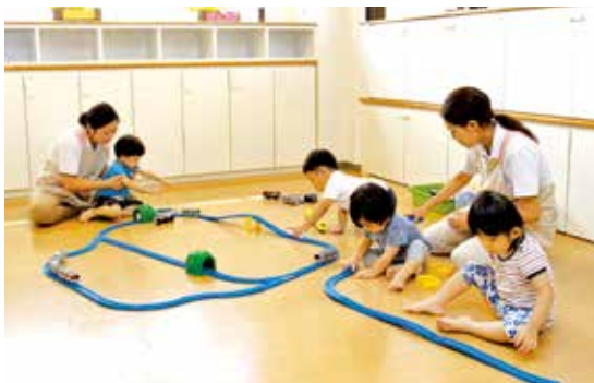
事業所内保育所「サクラさーくる」

多摩市の認可基準に基づく地域型事業所内保育所として、地域のお子様の受け入れも行っています。