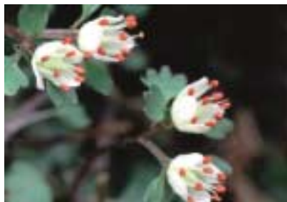
ハナネコノメ (ユキノシタ科ネコノメ属) 開花時期：3～4月