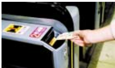
パスネットカードと2枚重ねて投入

さらに、パスネットカードについては、残額が初乗り運賃に満たない場合に、もう一枚のカードとあわせて投入できるよう自動改札機の改良を行ったほか、東京スタジアムでの各種イベントに対応し、最寄駅である飛田給駅への特急