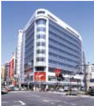
京王新宿追分ビル

また、京王不動産では、八王子みなみ野シティ分譲住宅11棟などを販売したほか、レンタル収納スペースの2号店となる「京王クローゼット堀之内」を12月に開業する予定です。