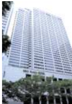
京王プラザホテル

京王プラザホテル(新宿)では、国内のシティホテルで初めて客室からの超高速インターネット接続を24時間無料で提供するサービスを開始するなど、国土交通の情報化に貢献したことが評価され、「平成13年度情報化月間国土交通大臣賞」を受賞いたしました。