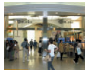
地下食品フロアをリニューアルオープンした京王百貨店新宿店

京王アートマンでは京王八王子店のリニューアルを行いました。また、京王ストアは、京王電鉄と共同で桜上水店を新しいスタイルのスーパーマーケット「キッチンコート」として、装いも新たに