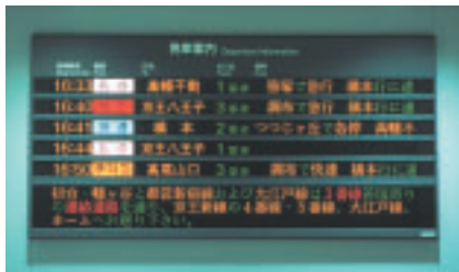
京王線新宿駅改良にとまない更新された行先案内板

また、8000系車両60両に車内電光表示板とドアチャイムの設置を行ったほか、体の不自由な方などにもご利用しやすい