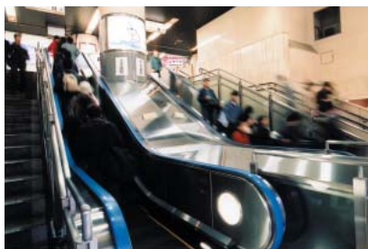
吉祥寺駅の車いす対応型エスカレーター

また、吉祥寺駅に車いす対応型のエスカレーターを増設するとともに、笹塚駅と吉祥寺駅で体の不自由な方などにも利用しやすい多機能のトイレを整備いたしました。このほか、桜上水駅とつつじヶ丘駅で電車とホームの段差を小さくするホーム床面改良工事を実施するなど、引続きバリアフリー化を進めました。