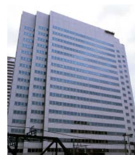
来年2月に竣工の京王品川ビル

京王電鉄では、京王笹塚西ビルを10月に完成させ、賃貸を開始いたしました。また、京王品川ビルについては、来年2月の竣工を目指し鋭意建設を進めているほか、さらに、調布