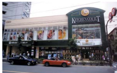
5月にオープンしたキッチンコート2号店「神楽坂店」