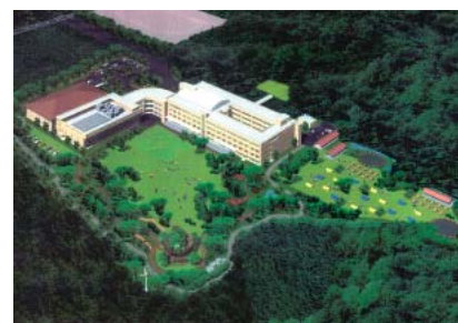
「多摩地域ユース・プラザ(仮称)」(イメージ図)