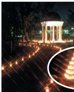
アンジェの クリスマス