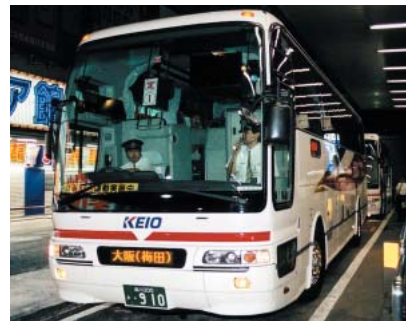
新宿～大阪(阪急梅田)線

高速バスでは、新宿～木曽福島線、新宿～大阪(阪急梅田)線を新設したほか、深夜急行バスでも、渋谷～吉祥寺駅北口系統を新設しました。