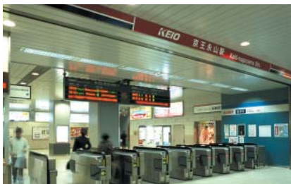
改修工事が完成した京王永山駅

京王電鉄では、京王永山駅においてコンコースやホームの改修工事が完成したほか、久我山駅では南北自由通路やエレベーターなどの設置を目的とした橋上駅舎化の改良工事に着手いたしました。