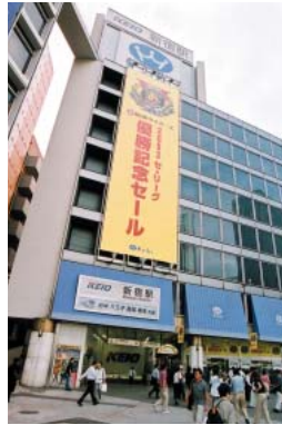
京王百貨店における 阪神タイガース優勝記念セール

京王電鉄では、グループ各社と共同で店舗戦略などを策定する「流通戦略プロジェクトチーム」を発足させました。これまでグループ各社が個別に進めていた情報収集などを共有化し、多角的な視点で出店条件の整備などを進めることにより、グル