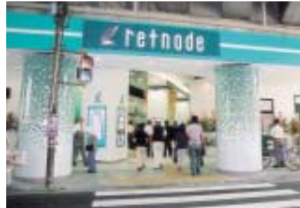
京王リトナード八幡山

オープンいたしました。さらに、稲城駅前、複合商業施設「(仮称)稲城駅前店舗」の建設に着手したほか、高井戸駅高架下店舗の改装工事を進めるなど、賃貸資産の拡充に努めております。