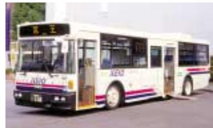
ノンステップバス

ンステップバス11両を投入し、これにより路線バス全車両の74%がバリアフリー対応となりました。また、9月から西東京バスは、「松枝住宅線」、「泉町住宅線」、「横川町住宅線」を再編成し、各住宅地から京王八王子駅と西八王子駅の両駅にアクセスが可能となり、利便性が向上しました。また、多摩バスは、羽村市のコミュニティバス「はむらん」の運行を受託いたしました。