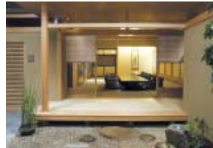
京王プラザホテル(新宿)樓石「蒼樹庵」

このほか、レストラン京王は、「高尾の森わくわくビレッジ」内に「カフェテリアろんたん」を、また、「ドールコーヒー