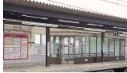
京王片倉駅の待合室

や京王片倉駅など9駅にホーム待合室を新設したほか、千歳烏山駅や京王八王子駅で行先案内板の電光表示化により、乗り継ぎ案内など情報提供の機能強化を図りました。