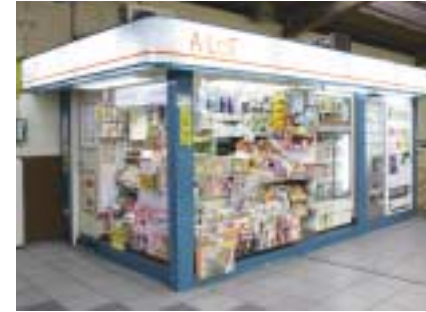
装いも新しくなった駅売店「A LoT(アロット)」

を「A LoT(アロット)」へ変更いたしました。また、コンビニエンスストア「K-Shop」八幡山店を新規出店させました。京王書籍販売は、「啓文堂書店」八幡山店を「京王リトナード八幡山」内に移転、8月に新装オープンいたしました。