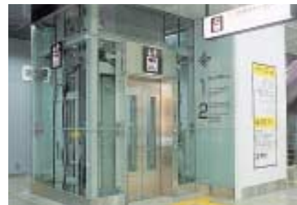
京王多摩センター駅のエレベーター

バリアフリー化工事では、幡ヶ谷駅や京王多摩センター駅、狭間駅において計5基のエレベーターを設置したほか、京王線の既存車両8両に車内電光表示板とドアチャイムの設置を行いました。旅客サービスでは、桜上水駅