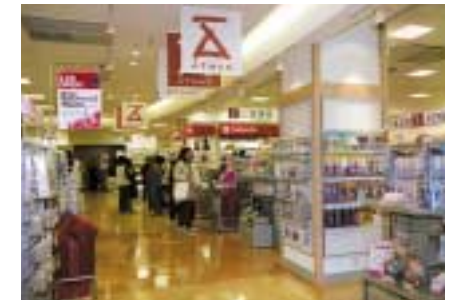
京王アートマン新百合丘店

また、京王パスポートカードについては、「京王グループ共通ポイントサービス」の浸透を図り、9月30日現在の会員数は約85万人となっております。