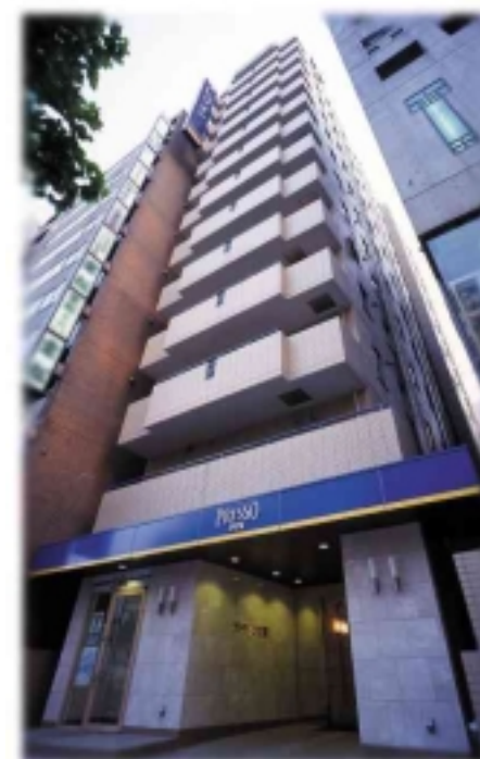
プレツソイン東銀座