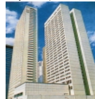
京王プラザホテル