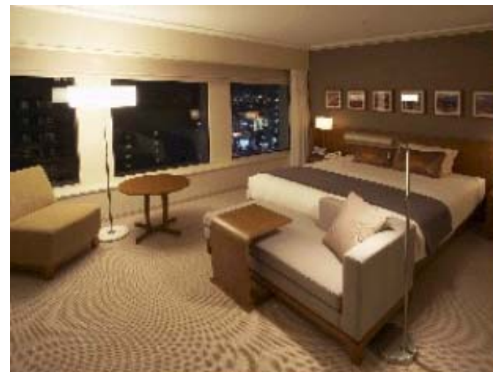
＜京王プラザホテル(新宿)＞ ・「プラザプレミア」の室内 (写真上)