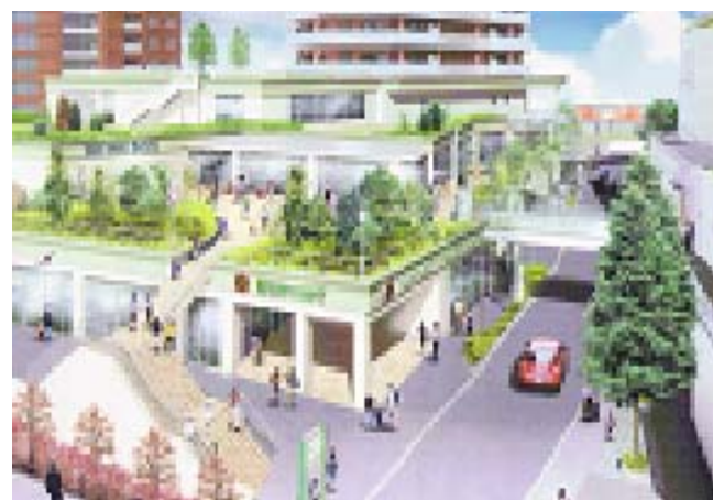
<京王ストア「キッチンコート」4号店>