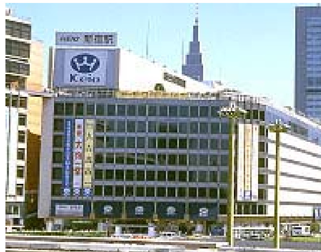
<京王百貨店（新宿店）>