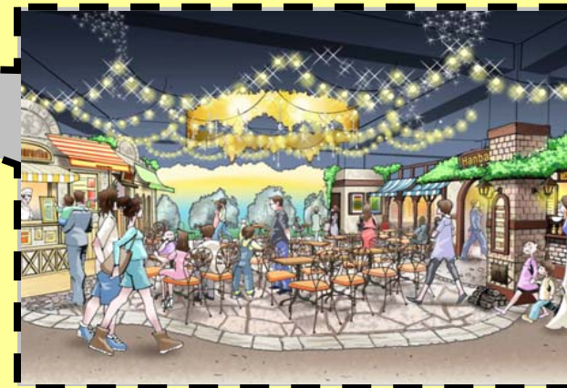
「東京ミートレア」完成イメージ