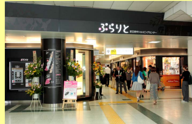
京王府中ショッピングセンター コンコース店舗「ぷらりと」