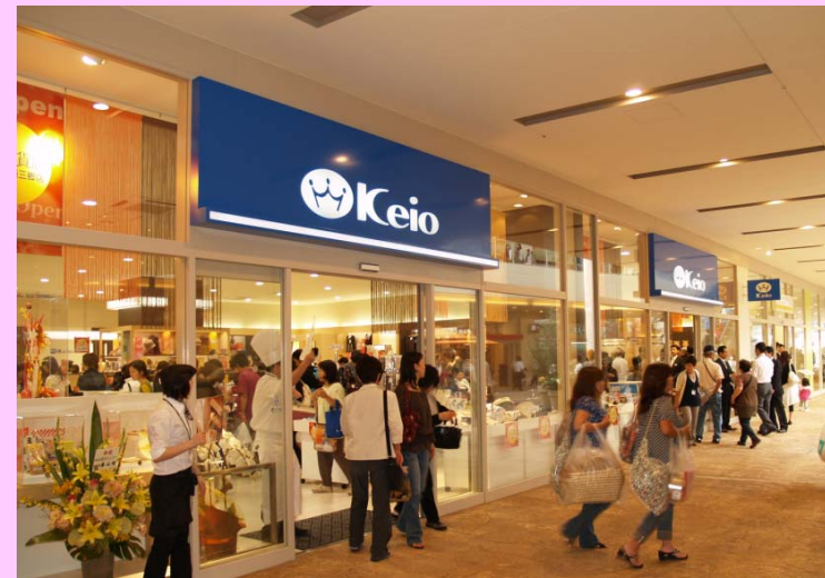
京王百貨店ららぽーと新三郷店

〔今後、小型サテライト店の運営モデルを確立させ、 当社駅ビルや他商業施設への展開を目指す〕