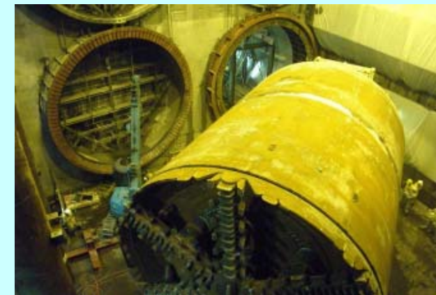
調布駅西側に到達したシールドマシン （調布～西調布駅間上り線トンネル貫通）