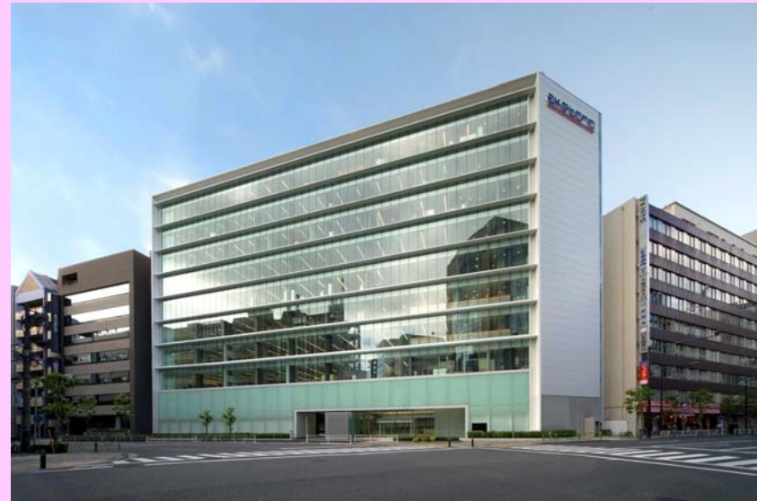
日本橋小網町ビル (土地・建物の6割を区分所有)

都心部オフィスビルを投資対象に、 引き続き安定した収益が期待できる稼働物件の取得を進めております