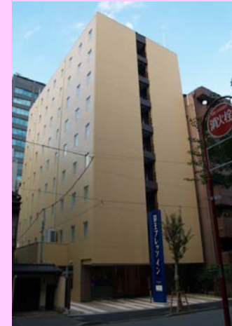
京王プレッソイン九段下