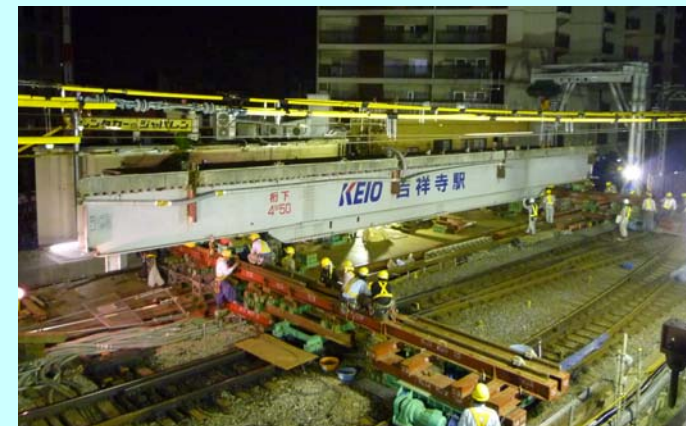
吉祥寺駅高架橋改築工事