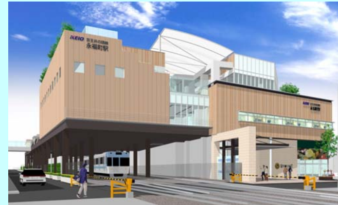
永福町駅（完成予想図）