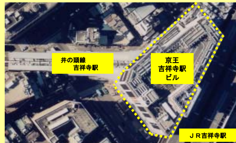
京王吉祥寺駅ビル上空写真(現況)

規模： 地上10階 地下2階、延べ面積：約28,000 m 2 、 高さ：約53 m、予定工期： 2010年4月～2014年3月