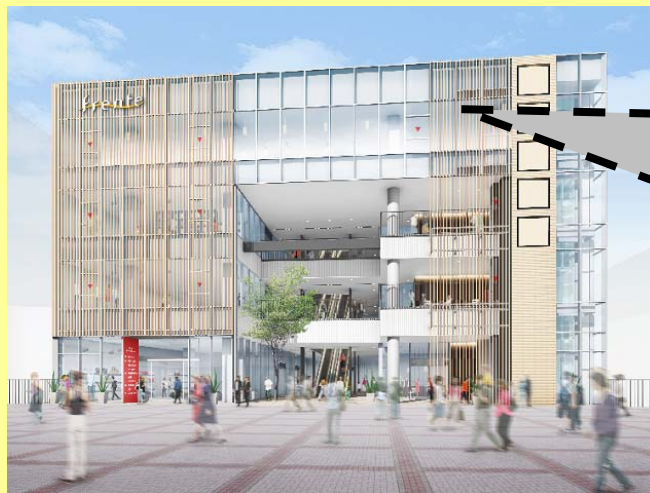
「フレンテ南大沢」新館 完成イメージ