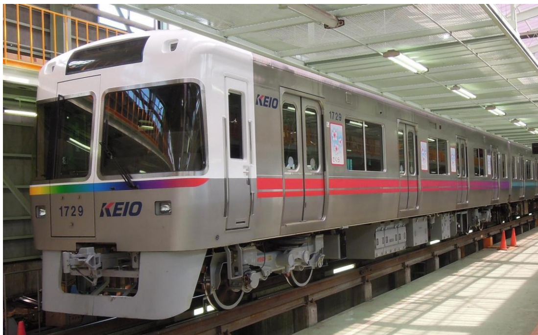
《ラッピング車両（吉祥寺寄りの先頭車）》