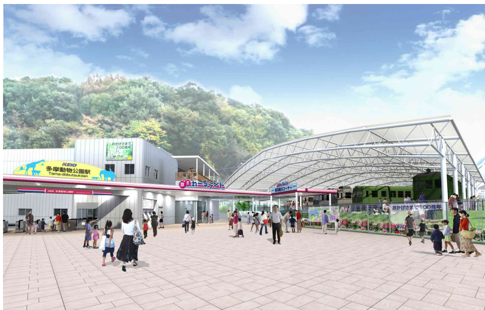
《新しい「京王れーるランド」（イメージ）》