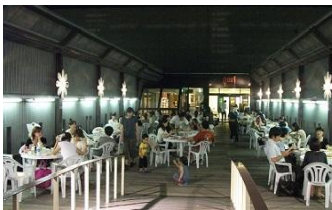
《「せいせきビアパーク」昨年の様子》