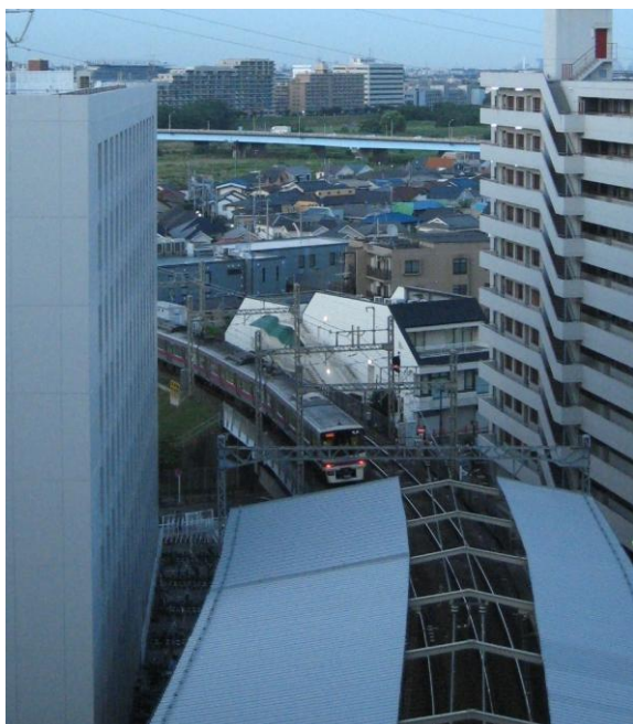
《会場から見える風景》