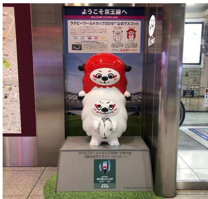
《設置したモニュメント》