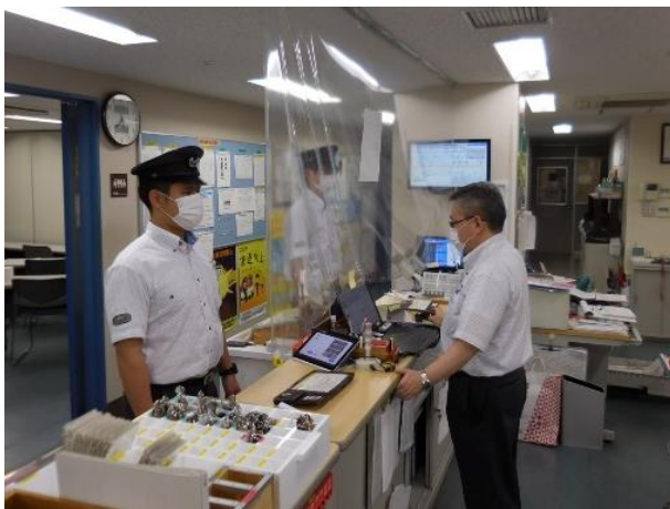
ビニールカーテンの設置（職場）