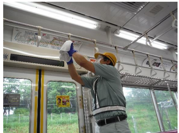
車内つり革の消毒