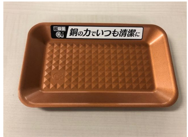
抗菌銅加工のキャッシュトレイへの変更