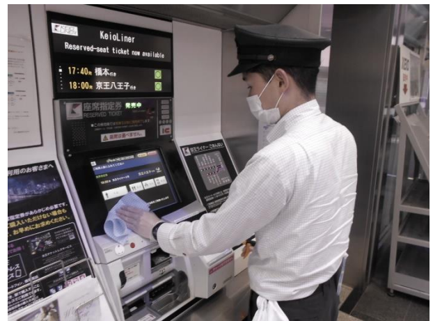
自動券売機の消毒