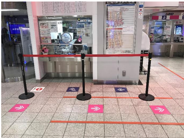
お並び位置の目安表示