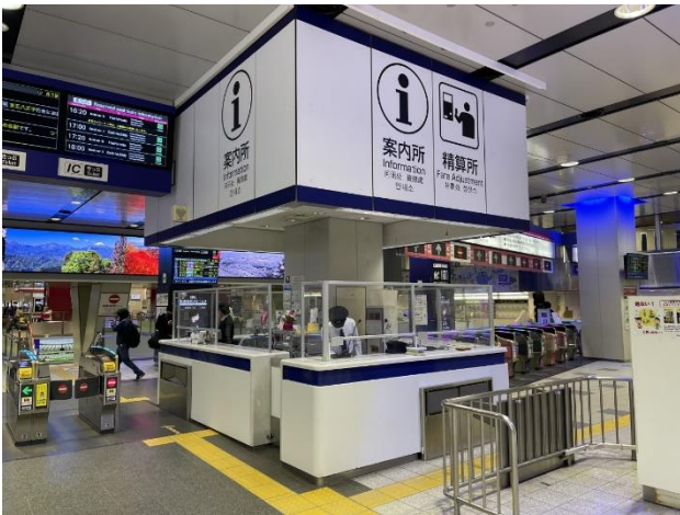
飛沫防止パネルと通話装置の設置