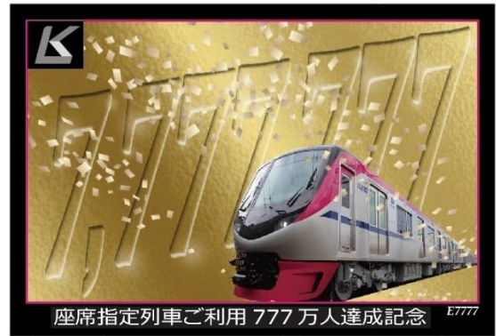
《オリジナルトレーディングカード》