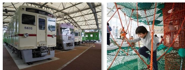
B賞 (小児)：京王れーるランド 京王あそびの森 HUGHUG 〈ハグハグ〉