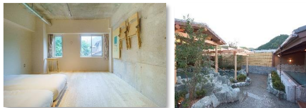
B賞 (大人)：タカオネ ペア宿泊券 京王高尾山温泉/極楽湯入浴券