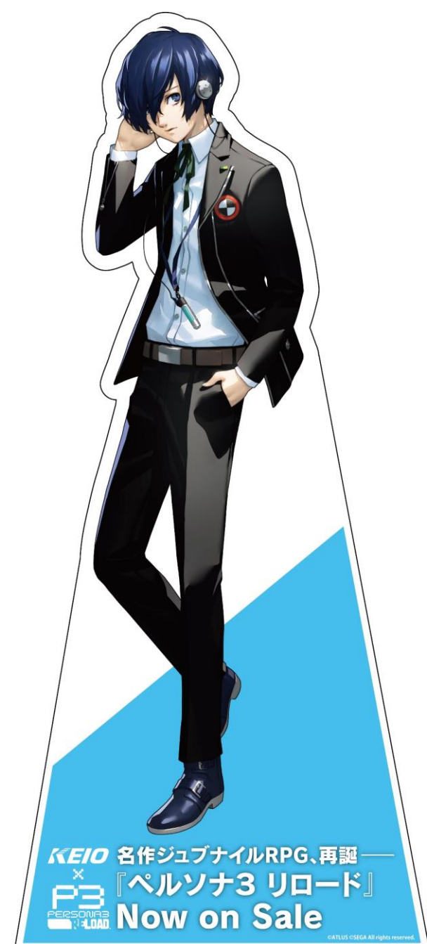
《等身大キャラクターパネル (全10名)》

KEIO 名作ジュブナイルRPG、再認 × 『ペルソナ3 リロード』 Now on Sale