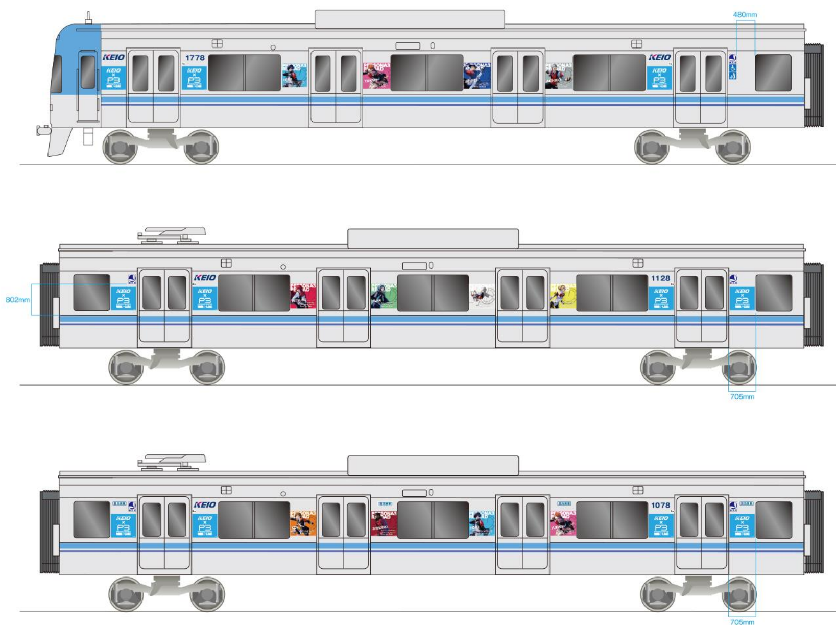
<<ラッピングイメージ>>