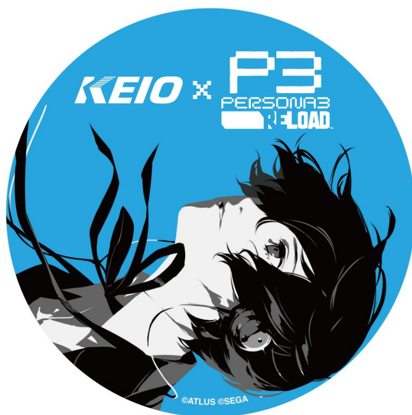
<<ヘッドマークイメージ>>