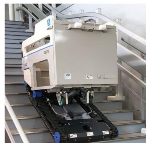
使用する階段昇降機