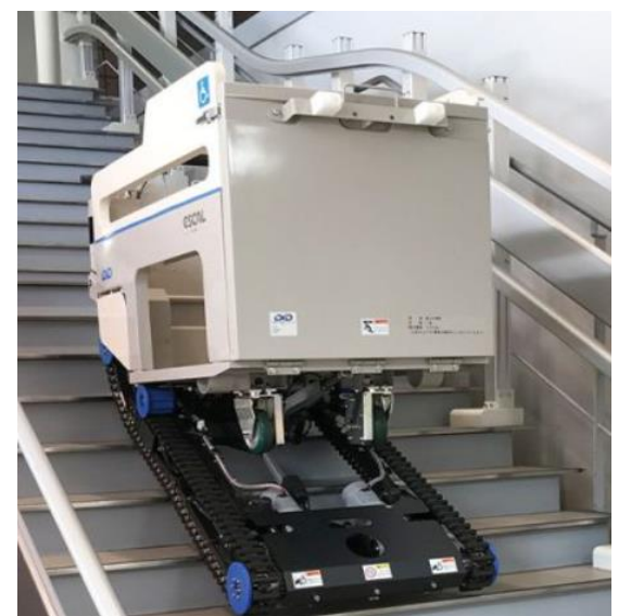
使用する階段昇降機