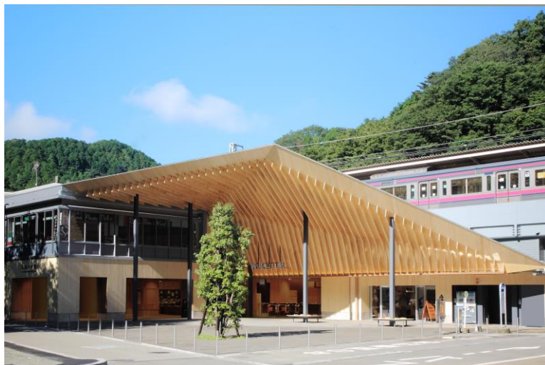
《新しく生まれ変わった京王線高尾山口駅》

また、LED照明の採用やお客様のニーズの高い清潔感あふれる節水型トイレの増設など環境に配慮した駅舎となっています。