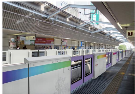
吉祥寺駅のホームドア（イメージ）