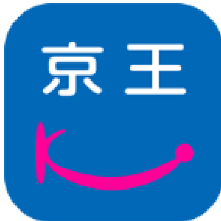
《京王アプリ ロゴマーク》