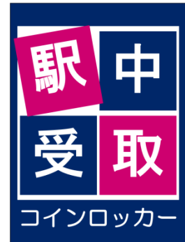
《「荷物受渡サービス」ロゴ》