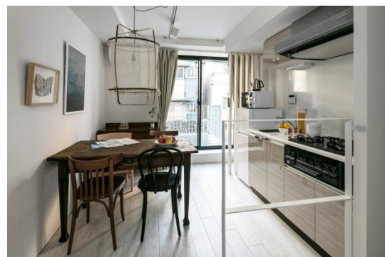
《KARIO KAMATA（カリオ カマタ）の外観（左）・客室内一例（右）》