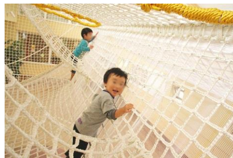
《ネット遊具イメージ》