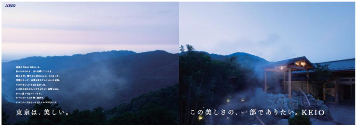
《ポスターイメージ（高尾山 温泉篇）》