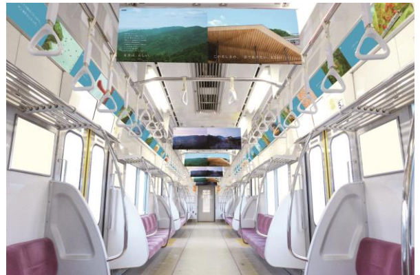
《トレインジャック（イメージ）》