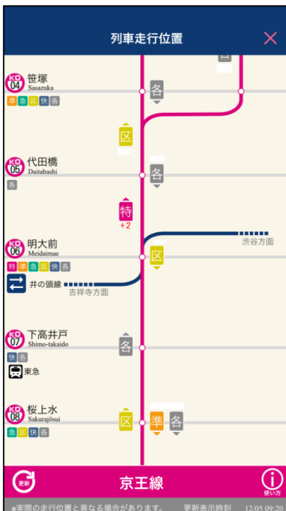
列車走行位置画面