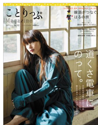
《ことりっぷマガジン春号》

2014年5月に誕生した、年4回発行の季節号です。旅好きな人にもっと旅してほしいという思いから四季折々のとっておきの旅先をことりっぷ目線で毎号掘り下げて特集しています。季節ごとの旅特集やタイムリーなおでかけ情報など、日常でも旅ごころを忘れない、旅好き女子のための旅行ライフスタイルマガジンです。