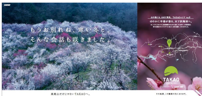
《ポスターイメージ》