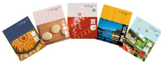
《ことりっぷガイドブックイメージ》

「ことりっぷ」は、働く女性が週末に行く2泊3日の小さな旅を提案したガイドブックで、発行部数1,500万部を超える大人気シリーズです。2017年3月現在、国内版66点、海外版39点、会話帖9点の計114ラインアップを展開しています。2008年に創刊以来、旅好きな女性に多数の支持をいただいています。女性の誘客を目指す自治体や交通関連、大学、流通関連、飲食店、女性向け商品のメーカーなど幅広い法人様とのコラボレーションを展開しているブランドです。