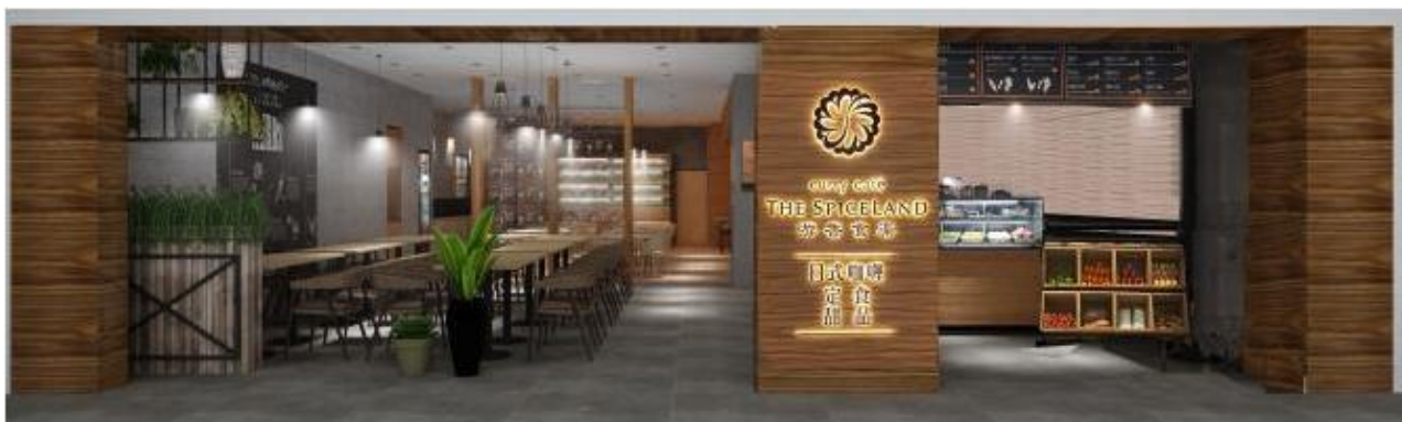
《游香食楽（ゆうこうしょくらく）5号店イメージ》