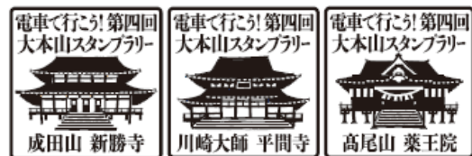
寺院スタンプ（イメージ）