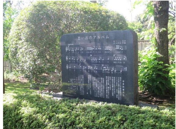
《「思い出のアルバム」歌碑》