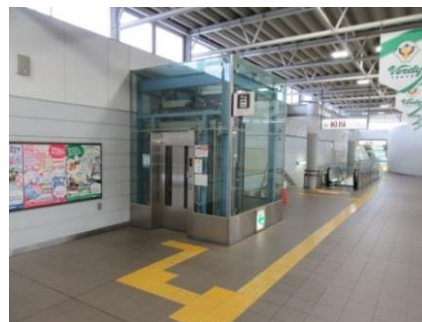
《ホームドアイメージ（左）、現状の飛田給駅エレベーター（右）》